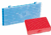
CAS ▶ PATRZ STRONA 98